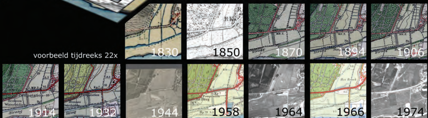
voorbeeld tijdreeks 22x

U levert een locatie (X,Y coördinaten RD) en ontvangt binnen 3 werkdagen het geselecteerde digitale product in uw email. Hiermee verkrijgt u een unieke kijk op historische gebeurtenissen, landschappen en ontwikkelingen.